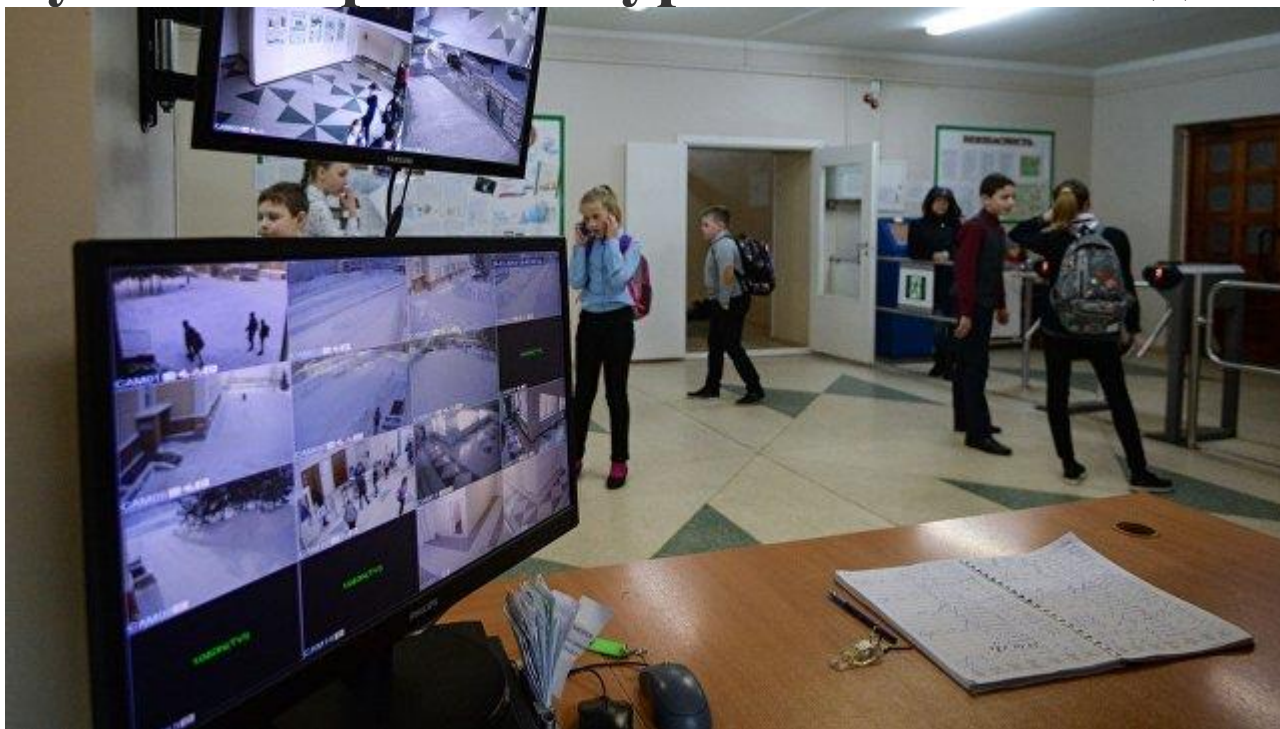
Перейти в фотобанк