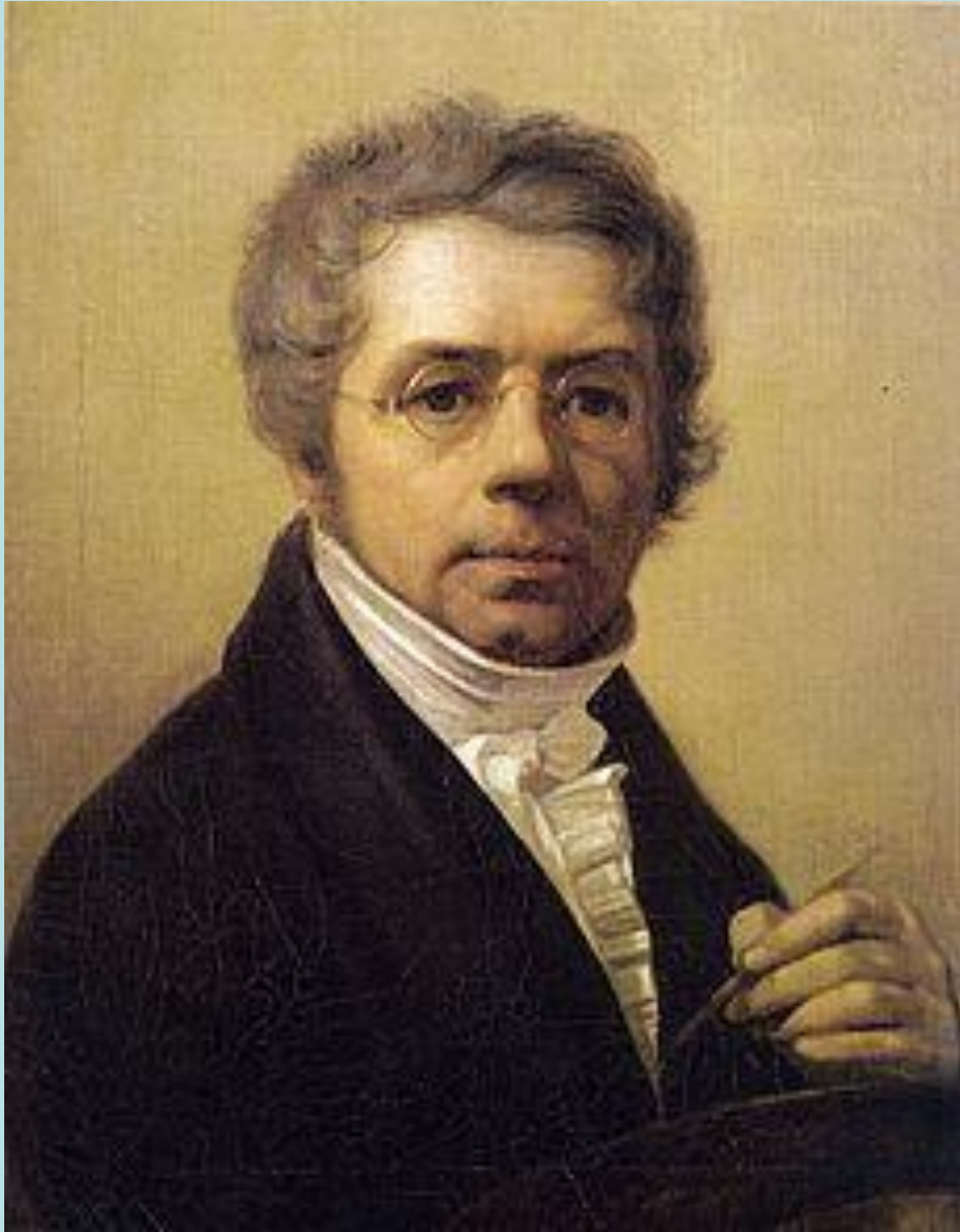
Автопортрет, 1811 год