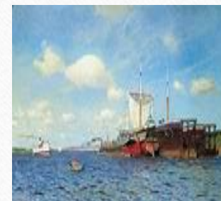
Свежий ветер. Волга