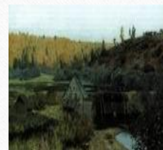
Осень. Мельница. Плес