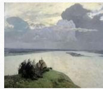
Над вечным покоем