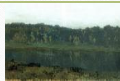
Осеннее утро. Туман