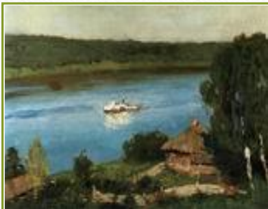
Пейзаж с пароходом