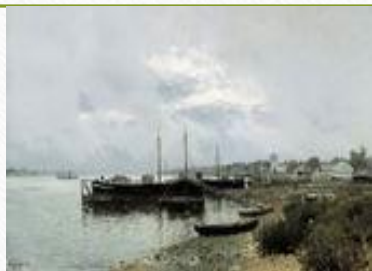
После дождя. Плес