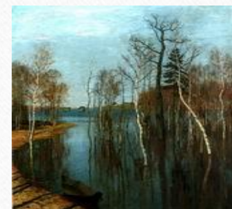
Весна. Большая вода