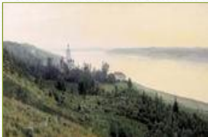
Вечер. Золотой Плес